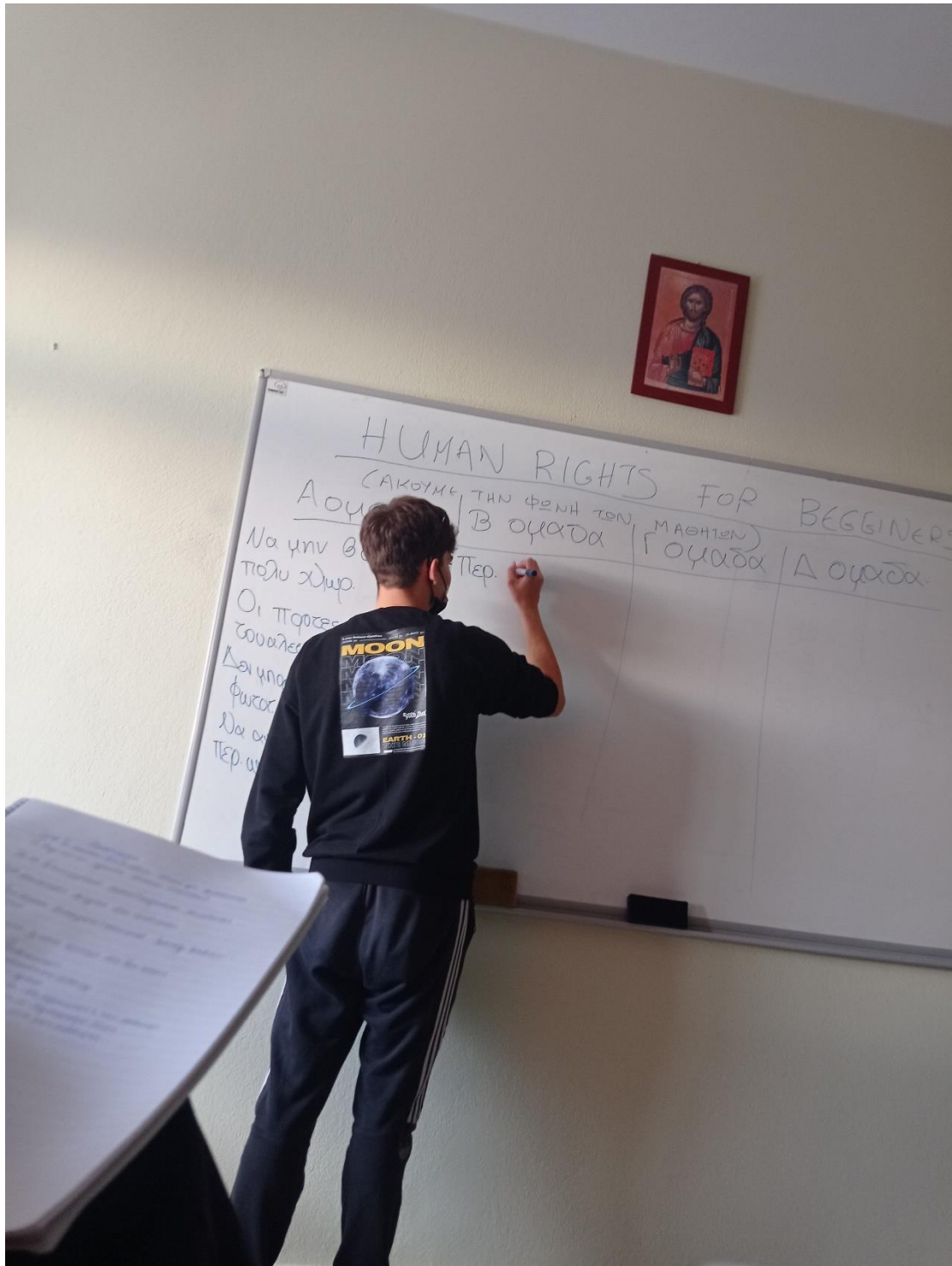
Καταγράφονται τα αποτελέσματα της διαβούλευσης των μαθητών ανά ομάδα στον πίνακα της τάξης.